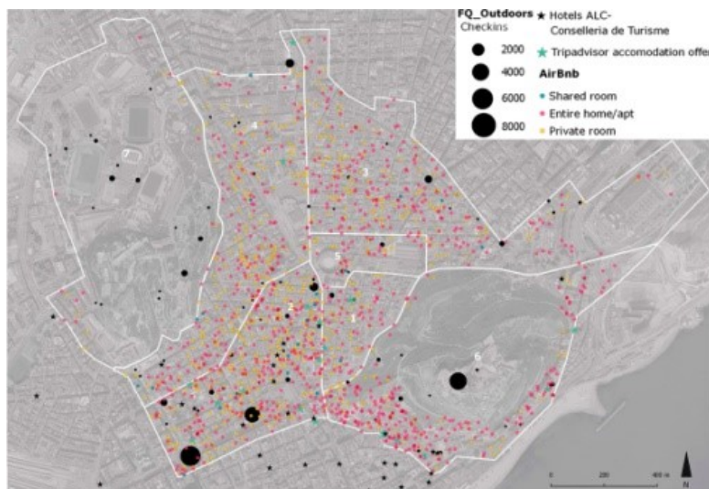
Figura 2: Vista de la oferta de hoteles y otros alojamientos turísticos en la ciudad de Alicante

como en distintos clusters de agrupación?, ¿Qué discontinuidades en la actividad comercial se identifican? o ¿Cuál es la mejor localización para un determinado negocio?