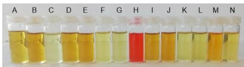
Figura 2: Test de detección selectiva de iones nitrito (NaNO 2 , disolución H), frente a trece aniones, utilizando una 7-formilindolizina en medio ácido. Sales: KCN (A), PhCO 2 K (B), KF (C), KCl (D), KBr (E), KI (F), KOAc (G), K 2 P 4 O 7 (I), K 3 PO 4 (J), KH 2 PO 4 (K), NaN 3 (L), K 2 S (M) y NaHS (N). Todas las concentraciones son 10 -4 M en acetonitrilo o acetonitrilo-agua.

Los productos resultantes han mostrado una elevada selectividad en la detección de iones nitrito frente a otros trece aniones en medio ácido. La presencia del ión nitrito con este ensayo se manifiesta en disolución con la aparición de una coloración que va de rojiza, más o menos intensa, a rosácea, dependiendo de la concentración del ión nitrito, mientras que el resto de los aniones presenta una coloración amarilla pálida o son incoloros (véase Figura 2).