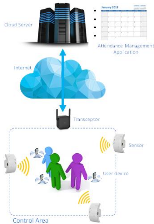
Fig 1. Esquema general del sistema

La zona de control es la zona en la que se monitoriza la presencia del trabajador. Esta zona de control será establecida por la tecnología de comunicación inalámbrica, normalmente la comunicación Wi-Fi.