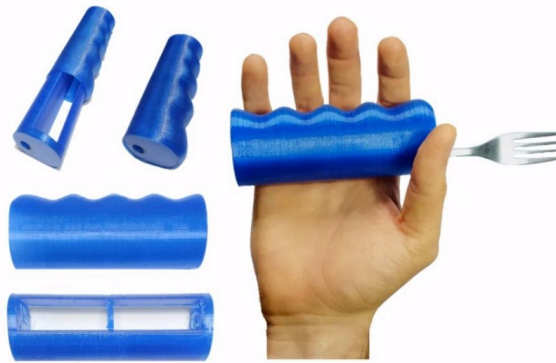
Figura 2: Prototipo del dispositivo con cabezal para comer