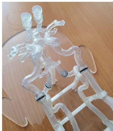
Figura 2: Vista en detalle de la red arterial del prototipo

Se dispone de un prototipo desarrollado a partir de la participación de diferentes especialistas médicos que han probado y ajustado las dimensiones y prestaciones del simulador (véase Figura 2 ). Por tanto, se ha conseguido un dispositivo que cumple perfectamente los objetivos buscados.