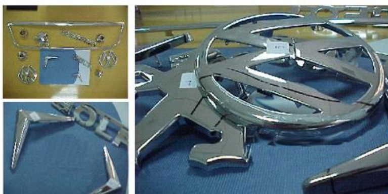
Figura 2. Distintas piezas fabricadas por una empresa de recubrimiento de cromo sobre plásticos

A partir de las conclusiones extraídas del estudio realizado con dicha herramienta, se estará en disposición de diseñar el prototipo de inspección que tendrá como banco de pruebas los motivos de la industria correspondiente, como por ejemplo, del recubrimiento electrolítico de cromo sobre plásticos (Figura 2. ).