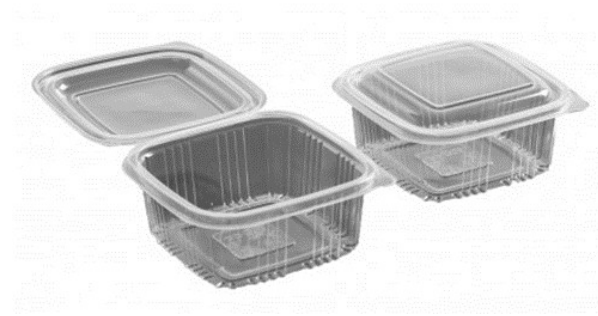
Fig 2. Envases generados con la nueva tecnología