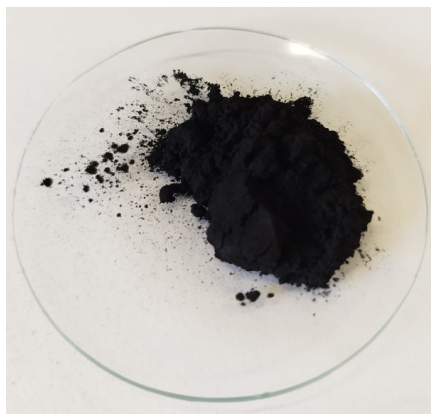
Imagen 1: Catalizador sintetizado en forma de polvo fino.

Los catalizadores heterogéneos obtenidos mediante este novedoso procedimiento se caracterizan porque: