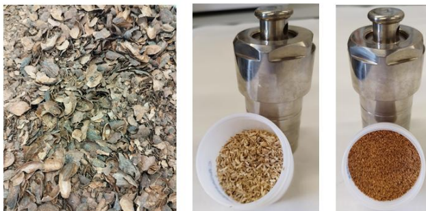
Imagen 2: Diferentes residuos de biomasa utilizados en los ensayos de laboratorio, entre ellos: cáscara de cacao, madera de eucalipto y cáscara de almendra, respectivamente.

A continuación, se muestran algunos ejemplos de diferentes residuos de biomasa utilizados en los ensayos de laboratorio para sintetizar estos novedosos catalizadores ( véase Imagen 2 ):