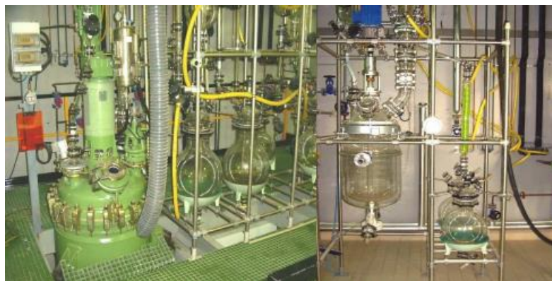
Figura 3: Planta piloto