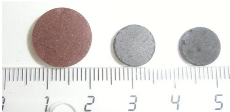
Figura 1: monolitos de carbón activo obtenidos a partir de cáscaras de cacao durante las distintas etapas de preparación (de izquierda a derecha: fresco, carbonizado y activado)

Mediante este novedoso procedimiento, se obtienen monolitos de carbón activo perfectamente definidos y que poseen una elevada resistencia mecánica (véase Figura 1).