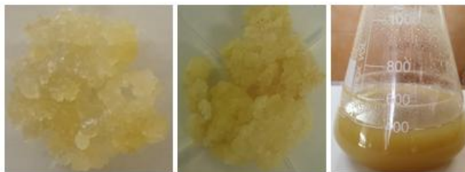
Imagen 1: Evolución del crecimiento de las células vegetales de mora (clones "blanco" y "rojo") desde el estado sólido hasta el estado en suspensión líquida. El nombre de clon "rojo" obedece al color de los frutos del espécimen del que procede (las células vegetales de ambos clones, "blanco" y "rojo", tienen el mismo color).

A continuación, se pueden observar algunas imágenes de las células vegetales de mora obtenidas: