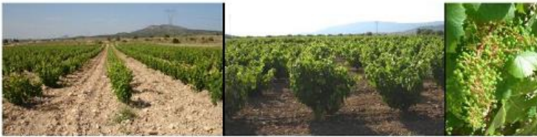
Imágenes de los cultivos analizados con la tecnología vía satélite.

En este sentido, los sistemas multispectrales proporcionan datos exactos sobre determinados parámetros del cultivo (por ejemplo: forma, tamaño, vigor del fruto...) que, a su vez, se pueden relacionar con la calidad y el rendimiento final en condiciones de campo. Por tanto, los sensores de teledetección permiten usar imágenes vía satélite para hacer un seguimiento en profundidad sobre el crecimiento, las necesidades de riego y la madurez del cultivo y, en consecuencia, establecer las necesidades de fertirrigación.