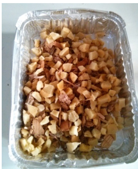
Figura 1.- Mezcla inicial de residuos de muebles con espuma de poliuretano

El material compactado desarrollado está formado principalmente por biomasa natural y goma espuma (Figura 1). Mientras la biomasa (lignocelulósico) está compuesta por residuos o derivados de la madera, la goma espuma está formada por espuma de poliuretano o similares procedentes de restos de sofás, cojines, almohadas, sillas, colchones, etc.