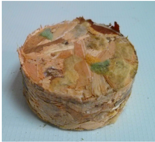
Figura 2.- Briqueta obtenida con la mezcla de residuo de mueble y espuma de poliuretano

Mediante este procedimiento se pueden obtener briquetas de 53 mm de diámetro y altura variable entre 20 y 60 cm, no obstante el procedimiento es aplicable a briquetas de cualquier tamaño. Asimismo, la briqueta puede tener cualquier tipo de forma, ya sea en forma de ladrillo, cilíndrica, en forma de pastilla, de cuadrado o similar.