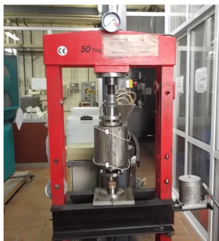
Figura 3.- Briquetadora empleada