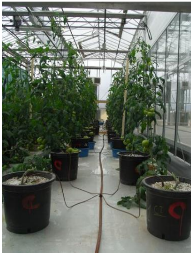
Figura 4. Fotografías del invernadero