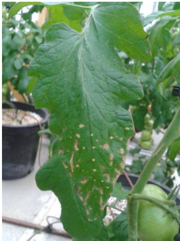
Figura 2. Activación del sistema de resistencia adquirida (SAR) en plantas de tomate por bacteriosis.

3. Mejora de la eficacia de los quelatos de micronutrientes, especialmente de hierro: Tradicionalmente la clorosis férrica ha sido el principal desorden nutricional en los cultivos desarrollados en los suelos calizos, si bien, también hay que considerar los efectos producidos por la carencia de otros micronutrientes como zinc y manganeso. Estas deficiencias son particularmente importantes en frutales y hortalizas, causando reducción en el desarrollo vegetal, en la fructificación y en la pérdida de calidad en las cosechas. En estos casos, la aplicación de micronutrientes al suelo o foliarmente se hace prácticamente obligatoria. Para el hierro, los quelatos sintéticos, especialmente FeEDDHA han demostrado ser la solución más eficaz, sin embargo su baja biodegradabilidad en el suelo ha despertado el interés por la búsqueda de soluciones igual de eficaces, pero sostenibles. En los últimos años, las investigaciones sobre correctores de micronutrientes se han focalizado en 3 vías principalmente: