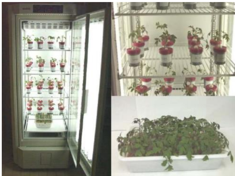
Figura 3. Fotografías de las cámaras de cultivo