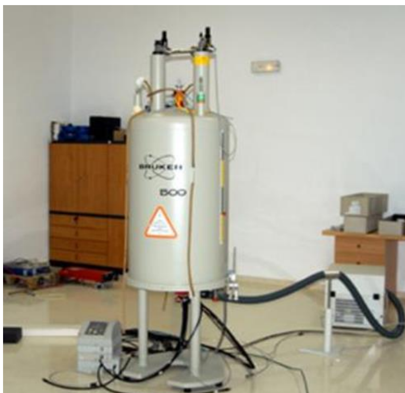
Figura 2. Espectrómetro de RMN de 500 MHz (BRUKER AVANCE DRX500) de los Servicios Técnicos de Investigación de la Universidad de Alicante

Además, el grupo tiene los conocimientos técnicos y la infraestructura necesaria (Servicios Técnicos de Investigación de la Universidad de Alicante) para llevar a cabo estudios de Espectroscopía UV-Vis, Espectrometría de Masas (MALDI-TOF y ESI-FTICR), Resonancia Magnética Nuclear de Alto Campo, Fluorescencia y Dicroísmo Circular entre otros, para conocer con exactitud los cambios conformacionales, el grado de modificación, la selectividad y la especificidad, y correlacionar así las consecuencias estructurales y funcionales derivadas del tratamiento electroquímico o químico como primer paso para entender cómo se produce el progreso de las enfermedades con disfunciones patofisiológicas.