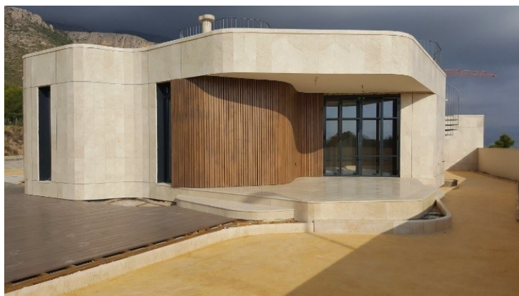
Figura 3: Vivienda "ADI 90.91.2.8.59.11.40.15"

Además, con la ayuda de este novedoso procedimiento ya se ha finalizado la construcción de una vivienda unifamiliar en Polop de la Marina (Alicante) con unos resultados muy positivos (véase Figura 3 ), mientras que un total de 8 viviendas más se encuentran en fase de proyecto.