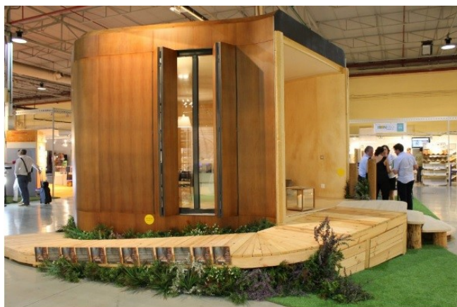
Figura 2: Prototipo "Arquitectura de Identidad"

Existe un prototipo de vivienda totalmente de madera elaborada con la presente tecnología y que fue expuesta en FIRAMACO 2016, la principal feria de Reforma y Rehabilitación de la provincia de Alicante. Este prototipo recibe el nombre de "Arquitectura de Identidad" y es una muestra de la personalización y facilidad de diseño en tiempo real durante una conversación entre el arquitecto y las personas que las habitarán (véase Figura 2 ).