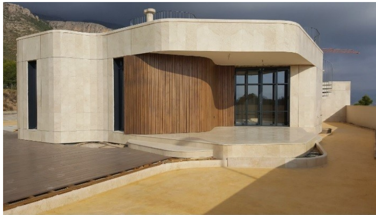
Figura 3: Vivienda "ADI 90.91.2.8.59.11.40.15"

Además, con la ayuda de este novedoso procedimiento ya se ha finalizado la construcción de una vivienda unifamiliar en Polop de la Marina (Alicante) con unos resultados muy positivos (véase Figura 3 ), mientras que un total de 8 viviendas más se encuentran en fase de proyecto.