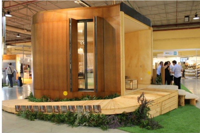
Figura 2: Prototipo "Arquitectura de Identidad"

Existe un prototipo de vivienda totalmente de madera elaborada con la presente tecnología y que fue expuesta en FIRAMACO 2016, la principal feria de Reforma y Rehabilitación de la provincia de Alicante. Este prototipo recibe el nombre de "Arquitectura de Identidad" y es una muestra de la personalización y facilidad de diseño en tiempo real durante una conversación entre el arquitecto y las personas que las habitarán (véase Figura 2 ).