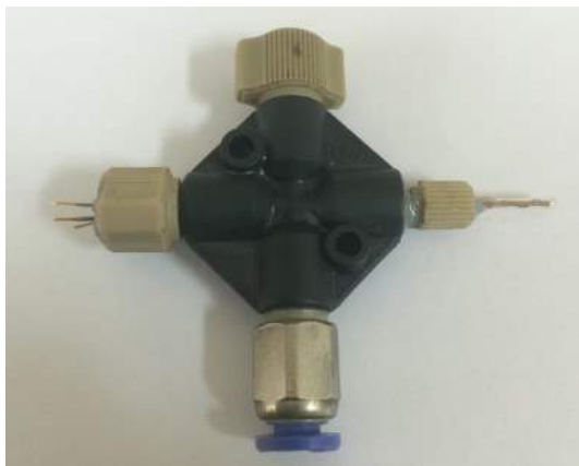
Figura 3. Fotografía del prototipo disponible en el laboratorio

Se ha desarrollado un prototipo a escala de laboratorio que está disponible para realizar cualquier demostración ( Figura 3 ). Los experimentos y ensayos realizados confirman su fiabilidad, reproducibilidad, robustez y fácil manejo.