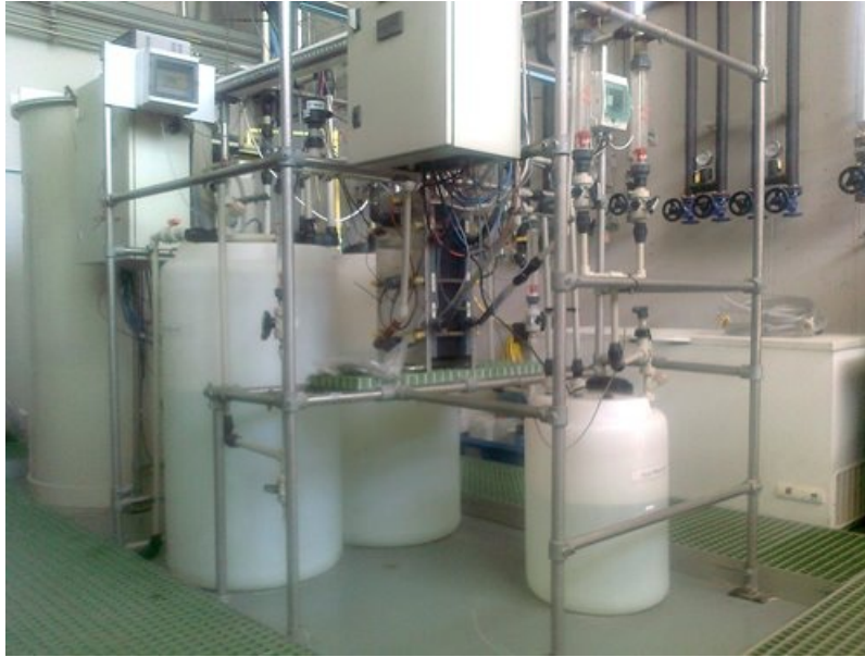
Figura 2.- Planta piloto de demostración

El grupo de Electroquímica Aplicada y Electrocatalisis (LEQA) dispone de muchos años de experiencia en el campo de la electroquímica habiendo llevado a cabo con éxito varios proyectos españoles y europeos. Todos los técnicos y responsables de la plantilla tienen amplia experiencia para garantizar el éxito de cualquier proyecto.