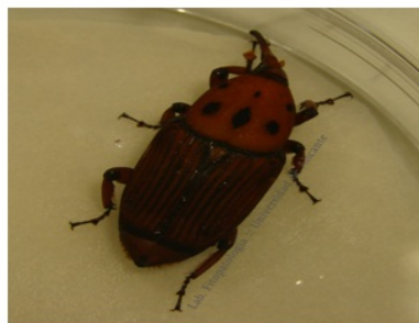
Larva y adulto de picudo rojo ( Rhynchophorus ferrugineus ).