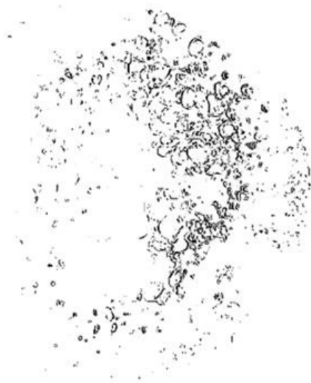
Paso intermedio de detección de células en la lente

Finalmente se calcula el porcentaje del área afectada proporcionando así al especialista una cuantificación de la opacidad que pueda interpretar. Para ello, se lleva a cabo una división del área del contorno de la lente calculado inicialmente y que determina la localización de la misma. Para cada una de las áreas calculadas, se realiza una cuantificación de los píxeles detectados como parte de la opacificación y se establece una relación entre éstos y el total de todos los píxeles que forman el área para obtener el porcentaje de opacidad final.