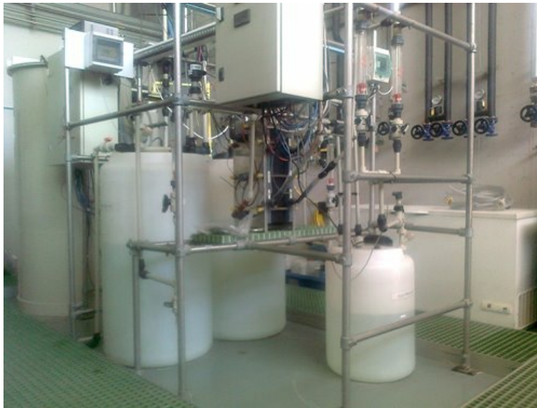
Figura 2.- Planta piloto de demostración